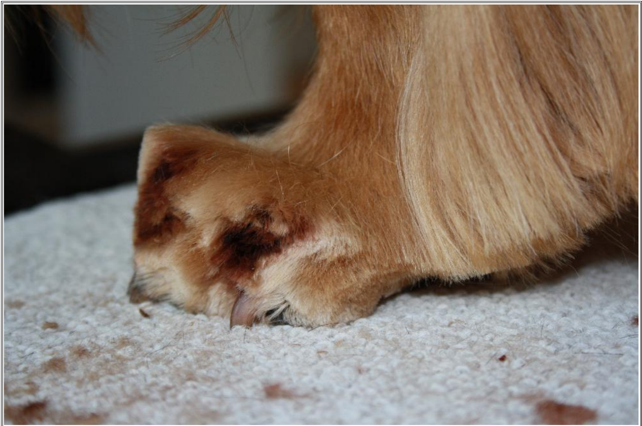
Vorgeschnittene Pfote fertig zum Effilieren