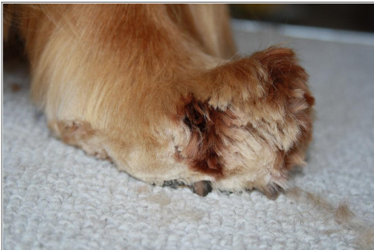
Innenseite der linken Vorderpfote: An der Daumenkralle von oben schneiden