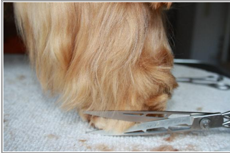
von hinten die Außen- und Innenseite der linken Pfote schneiden